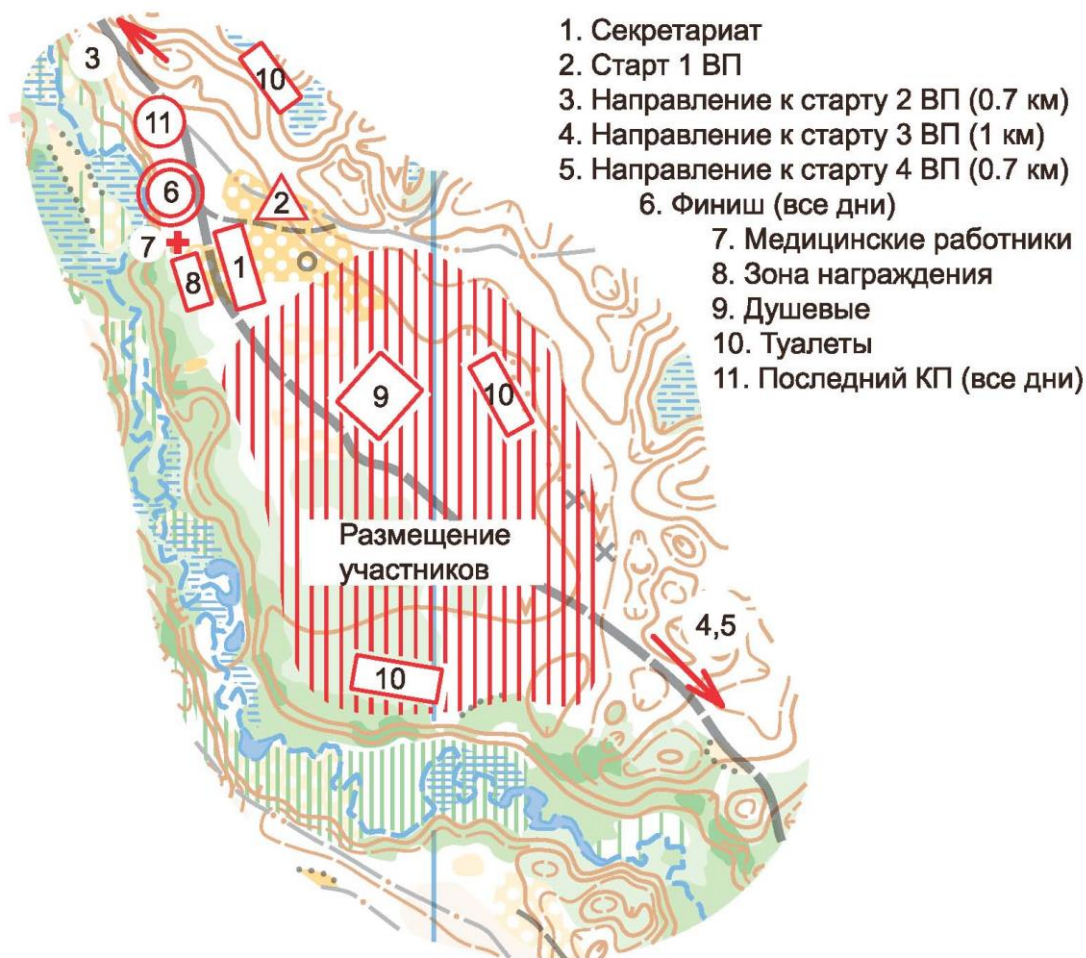
СХЕМА центра соревнований "Жемчужины России 2021"